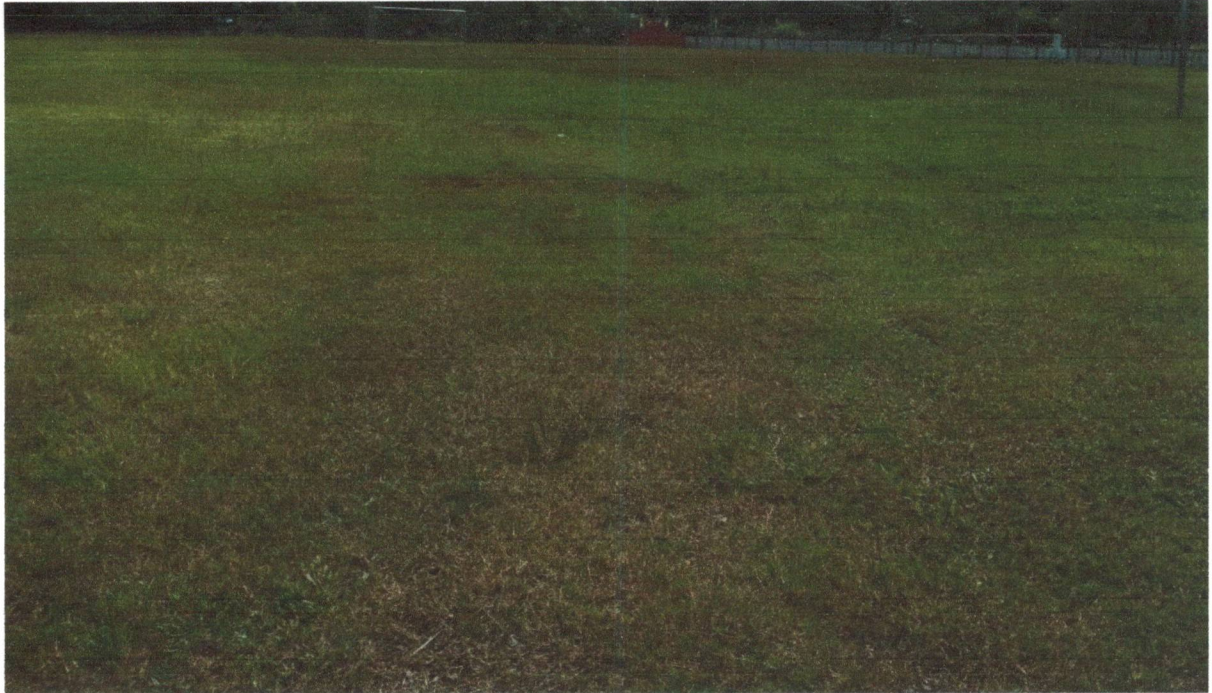
สนามกีฬา/ลานกีฬา หมู่ที่ 8