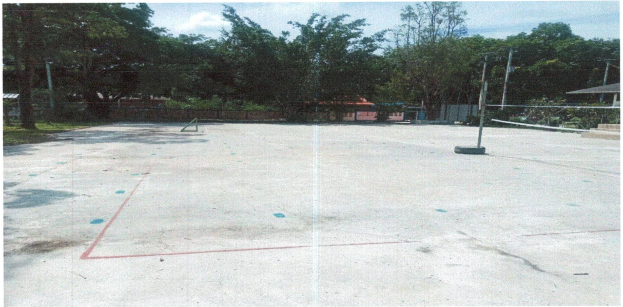
สนามกีฬา/ลานกีฬา หมู่ที่ 13