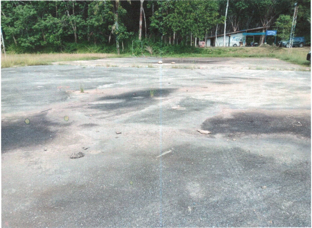
สนามกีฬา/ลานกีฬา หมู่ที่ 2