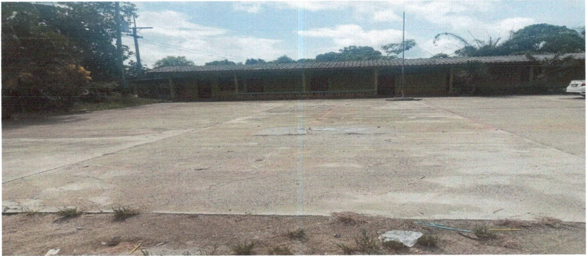
สนามกีฬา/ลานกีฬา หมู่ที่ 10